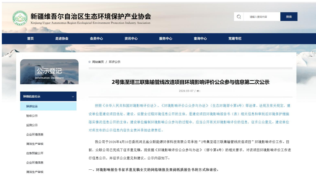
图 3-1 第二次信息公示情况

我公司在新疆维吾尔自治区生态环境保护产业协会网网站( http://www.xjhbcy.cn/articles/show/5924?is_preview=1&type=announce )上发布了征求意见稿公示信息,对环境影响报告书征求意见稿全文进行公开,公示时限为 10 个工作日,网站第二次公告截图见图 3-1。