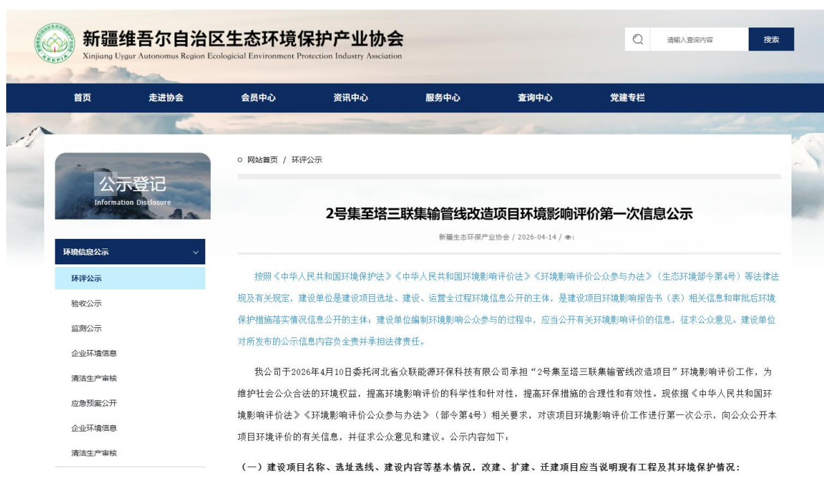
图 2-1 第一次信息公示情况

2026 年 4 月 14 日，我公司在新疆维吾尔自治区生态环境保护产业协会网 ( http://www.xjhbcy.cn/articles/show/5874?is_preview=1&type=announce ) 上发布了第一次公示信息。首次公示网络截图见图 2-1。